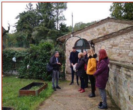
VIENDO CENTRO ATLAS