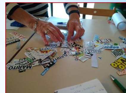
TALLER PALABRAS EN COLORES