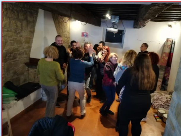
DINÁMICA DE DESPEDIDA