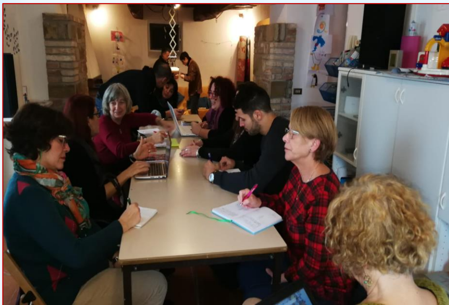
PARTICIPANDO EN REUNIÓN DE EQUIPO