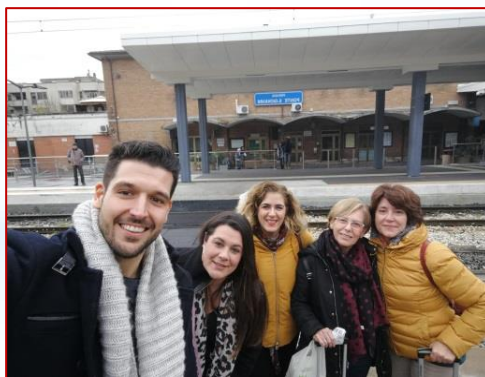
ESPERANDO EL TREN DE VUELTA A ROMA Y A ESPAÑA